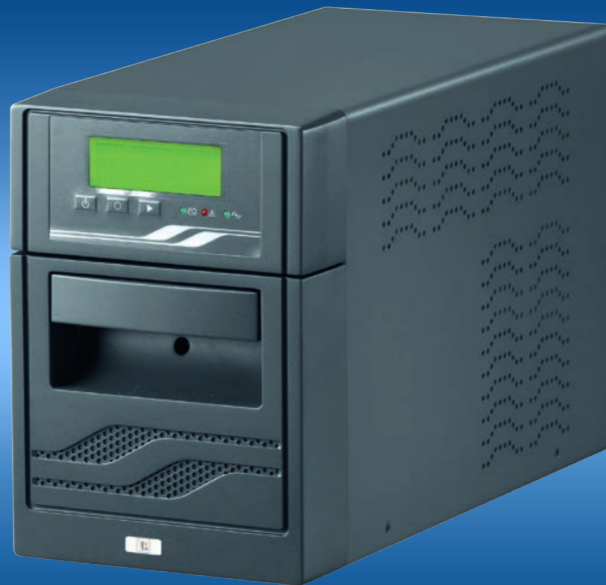
EA-UPS INFC 1000