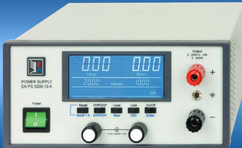
EA-PS 5200-10 A

Programmierbare DC-Tischnetzgeräte Programmable desktop DC Power supplies